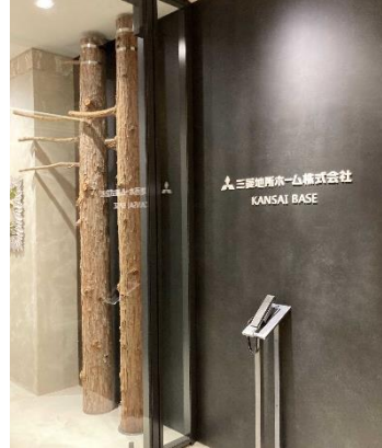
●オフィス内に設置されたヒノキの原木（山梨県産・岩手県産）とカラマツの苗木