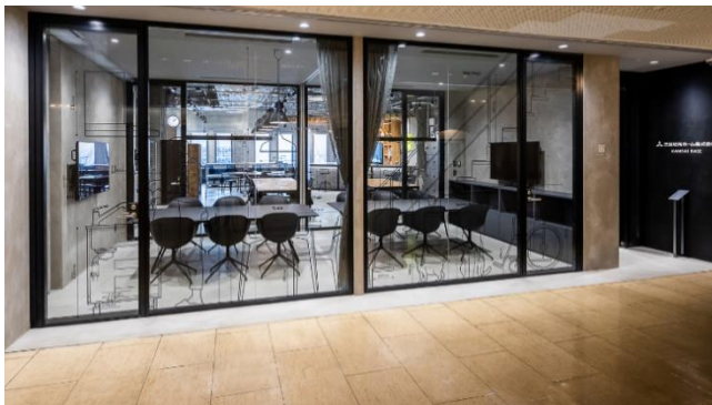
●オフィスと共用部を仕切るガラスウォール。表面にはグラフィックアートが描かれています。

ガラスウォールを通して、オフィスで社員がイキイキと働く姿や木のプロダクト（原木・デスク・シェルフ）が積極活用されるデザインを地域に向けて発信し、働くことの楽しさや住まい・デザインの楽しさを伝える機能を実装しました。