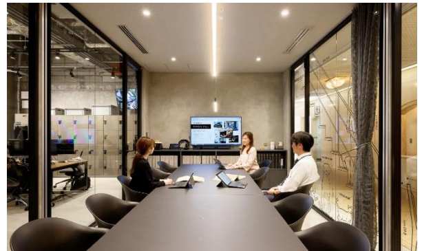
●オフィス内のミーティングスペース