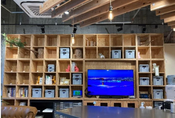
●FSC 認証構造用合板（山梨県産：カラマツ材）で制作されたシェルフ

木や自然が持つ力強さ・自社の大切な価値観に日々社員が触れることで、感性を開き、新たなアイデア創発につなげていく機能を実装しました。執務エリアでは、天然木の天板を使用した自社オリジナルデザインのデスクを製作し採用した他、各所に注文住宅事業において使用する構造材（国産材）を活用し空間を構成しています。さらに構造材の産地である山梨県と岩手県から切り出したヒノキの原木やカラマツの苗木も設置・展示しています。