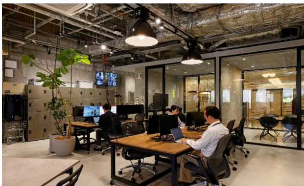
●ワークポイントの一例：シングルモニター席とダブルモニター席

固定席を廃止し、社員が業務内容に合わせて様々なタイプの座席からワークポイントを自由を選択する ABW (Activity Based Working) 型フリーアドレスを採用。対話やビジョンの共有を促す場となるカフェも設けました。