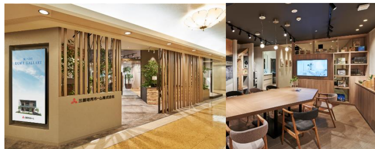
●別フロアに新設されたショールーム「芦屋ホーム&スタイル」 営業時間 10:00～19:00 定休日は施設に準じる