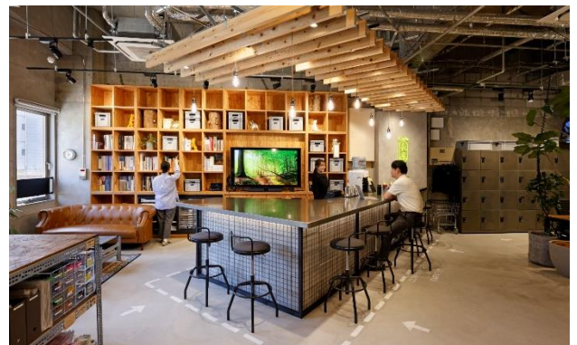
●執務スペースの中央に設置されたカフェ（café 長屋）