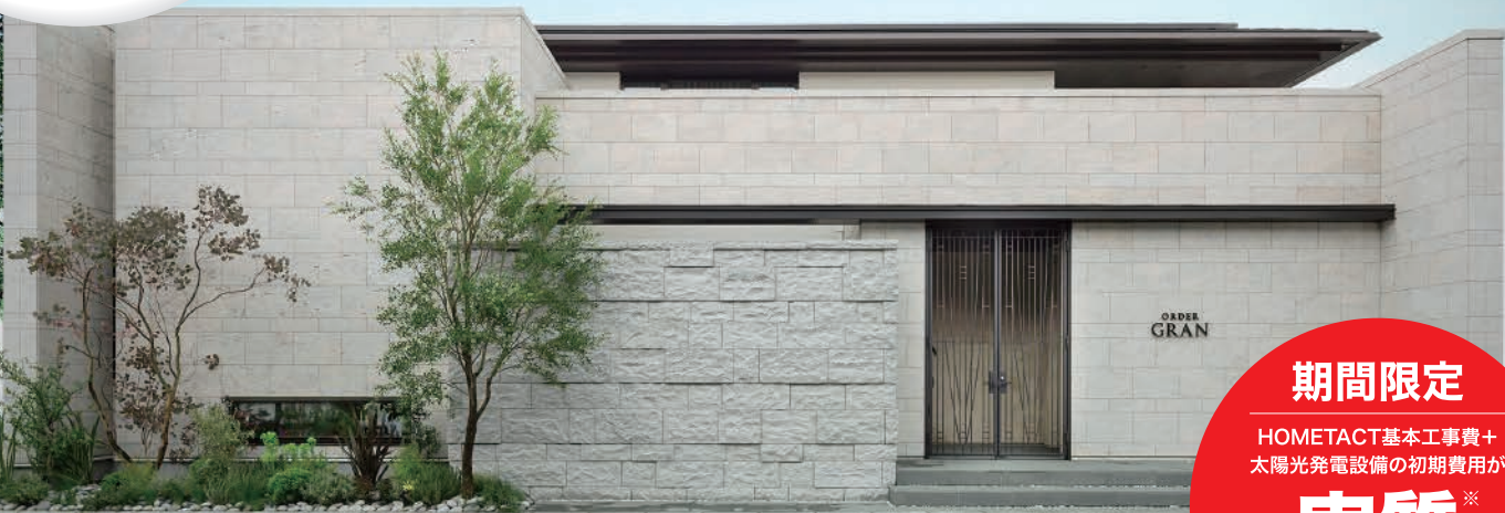
HOMETACT実装モデルハウス：駒沢ステージ2ホームギャラリー